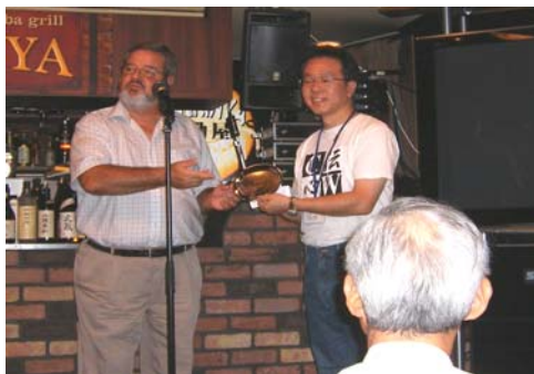
Remise du plateau UFT à JE1TRV

Ce qui fut fait, et enregistré sur la liste des Participants. Je pensais que cette soirée serait le moment idéal pour mieux faire connaissance, échanger nos idées et envisager toutes les formes possibles d'un partenariat, comme avec le KCJ.