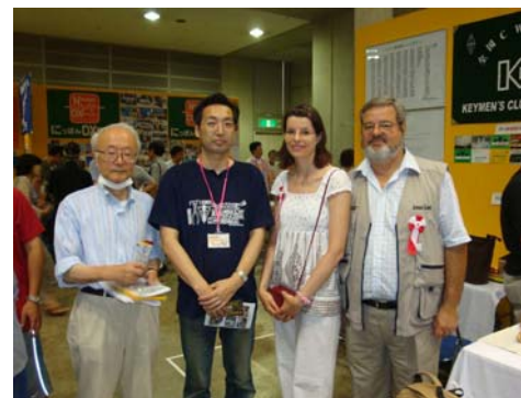
De gauche à droite : JA8AJE « Masa », JA7QLP « Hiro », Peggy, et F5EIC.

Je me suis aperçu que la plupart des OMs rencontrés étaient membres de ces deux associations.